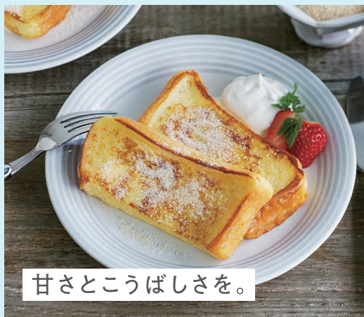
甘さとこうばしさを。