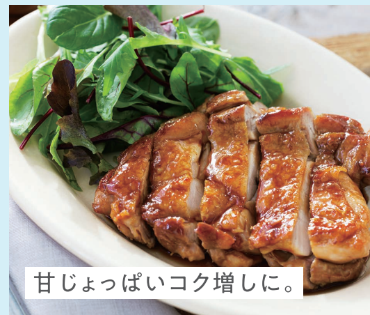
甘じょっぱいコク増しに。